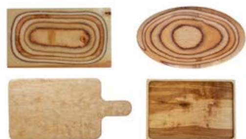
PLANCHE EN BOIS DE BOULEAU

Fabrication Artisanale - Chaque pièce est unique - Certificat Alimentaire - Résiste au lave-vaisselle. Possibilité de Personnalisation